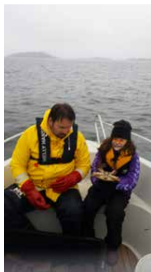
Lettmatrosen (for anledningen som løve) lærer å holde krabber.