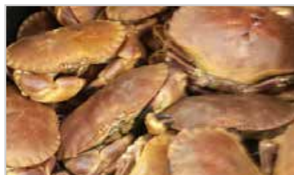
s12 | KRABBE FISKE