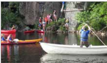
s4 | SOMMERLEIR