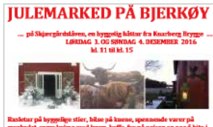
s15 | JULEMARKED