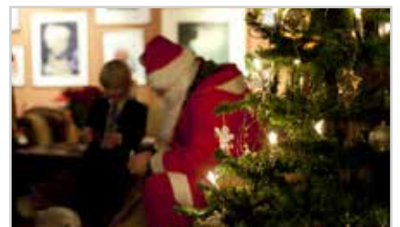
s16 | OPPSLAGSTAVLE