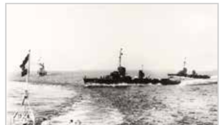
s5-9 | FRA BOLÆRENE