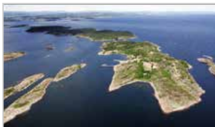
s5-9 | LOKALHISTORIE