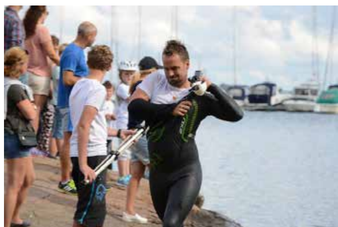
Skifte fra svømme til sykkelutstyr foregår i et effektivt tempo og med egne rutiner for de fleste.