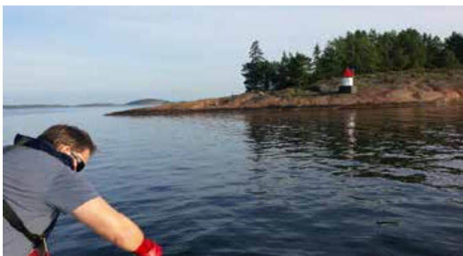
Sauene har nettopp reist fra Hvaløy, men krabbene har kommet frem.

Første trekket i år var vi heldige med, vi hadde bare 4 teiner ute og fikk 60 krabber. 58 rastløse hunnkrabber og 2 slitne hannkrabber, jeg biter i meg tanken om munken som metafor, det kan ikke være mulig å leve i sølibat på et havdypet med "snasne" nonner på alle kanter tenker jeg.