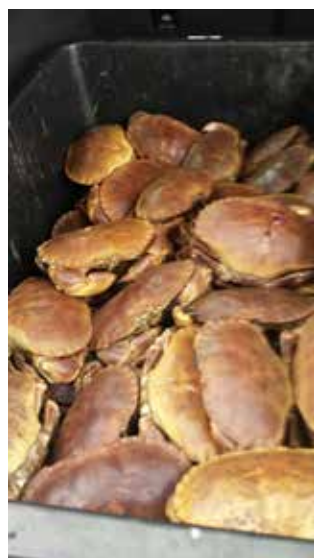
Klart for kok, en neve grovt salt pr. 15 liter vann, sånn cirka.