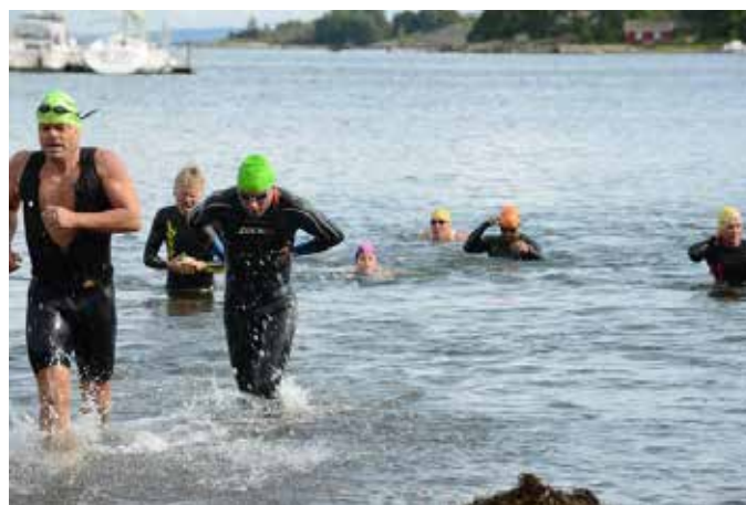
Etter 350 svømming løp deltakere opp på stranda og til sykkelstativer godt plasert i skogen

I Bergandysten kan man starte singel eller som lag. Lagene kan bestå av 2 eller 3 personer, kvinner og menn. Det viktigste her ifølge arrangøren, å få til et lokalt triathlon med masse morro og litt alvor. Om arrangementet vil vokse eller forbli på ca 50 deltakere fremover er ikke enda avklart. At det har potensialet til å vokse er tilstedet.