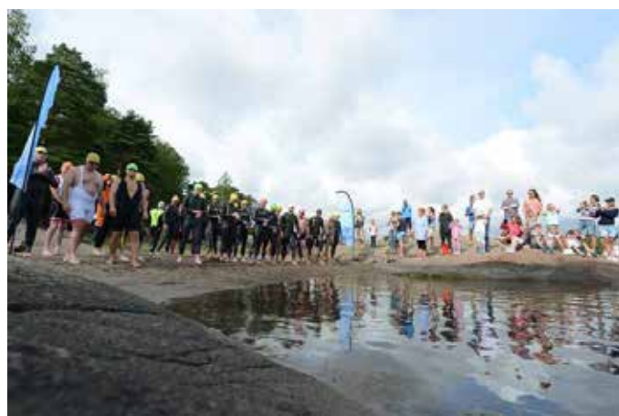
Deltakere klare før start. Sikkerheten med røde kors og svømmere i vannet var det sørget for.

Distansene er ca 350 m svømming, 25 km sykling og 6 km løping. Arrangøren mener selv at arrangementet foregår i verdens hyggeligste omgivelser på Nøtterøy. Det skulle vise seg å være meget sant. Samme dag gikk også SwimRun av stabelen og tidvis hadde begge arrangementene samme trasé. Det var derfor nok av tilskuere og bra stemning av triatleter og duatleter som ønsket å vise seg frem.