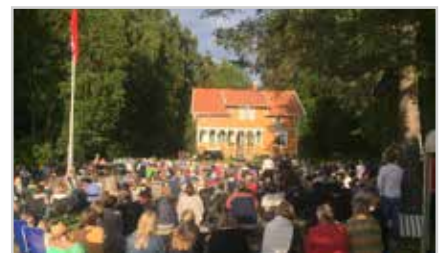
s13 | UNNI WILHELMOSEN KONSERT