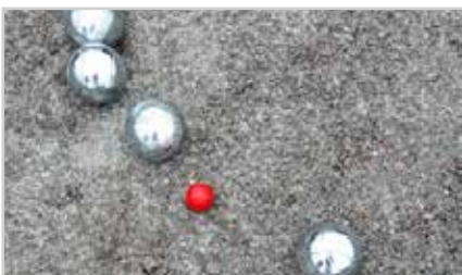
s14 | PETANQUE