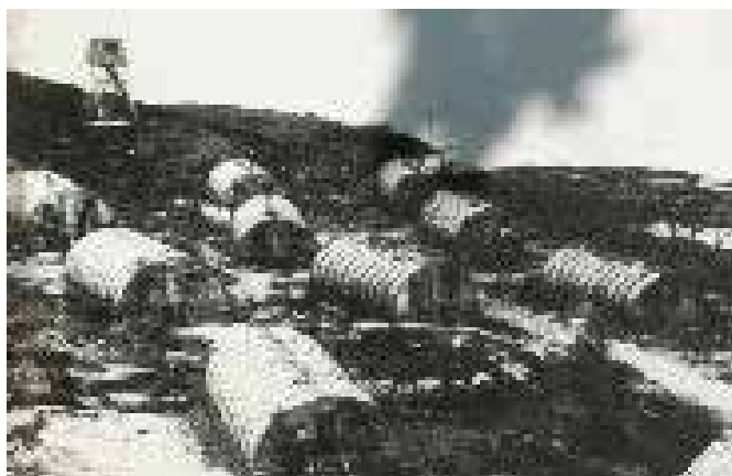
Bildet er tatt i 1945. Avfotografert fra informasjonstavlen på stedet.

Den tyske fangeleiren på Mellom Bolæren er et av de ørkeste kapitlene i Vestfolds historie: 480 russiske fanger stuet sammen for å dø.