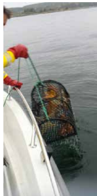
Det er tunge løft, men en belønning på bunn.