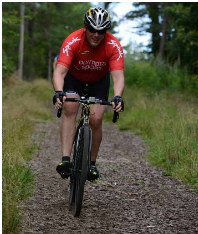
Tøff sykkel løype med variert underlag. Her fikk deltakere både grus, asfalt, gjørme og bark å bryne seg på.

I Bergandysten kan man starte singel eller som lag. Lagene kan bestå av 2 eller 3 personer, kvinner og menn. Det viktigste her ifølge arrangøren, å få til et lokalt triathlon med masse morro og litt alvor. Om arrangementet vil vokse eller forbli på ca 50 deltakere fremover er ikke enda avklart. At det har potensialet til å vokse er tilstedet.