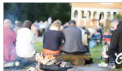
s6 | GOD STEMNING