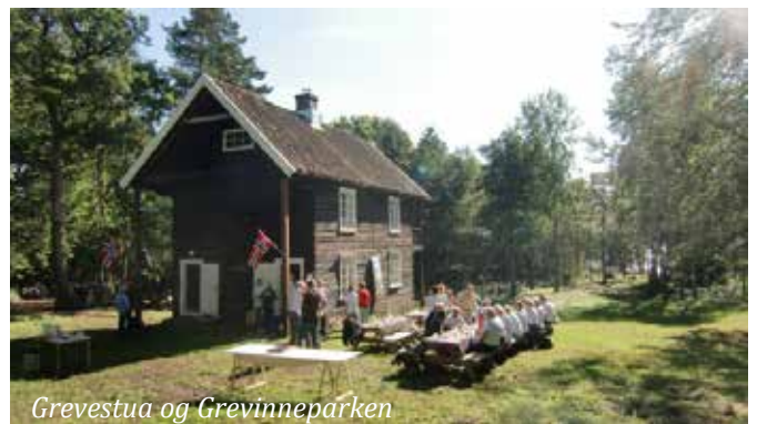
Grevestua og Grevinneparken

Mange ønsker å oppleve natur og kulturminnene på øya . Det har derfor vært en stadig pågang av grupper som vil til øya for å se Russlerleir, Grevestua, strandsittersteder og ikke minst, en rik og relativt uberørt natur. Øya har flere utrydningstruede arter som er rødlistet. Etter hvert som det ryddes, får disse artene bedre og bedre vilkår og øker mangfoldet her ute. Kanskje er dette noe av drivkraften bak MBVs store arbeidsinnsats på MB. I løpet av 2015 ble det lagt ned ca 3160 dugnadstimer. Alle er hjertelig velkommen til å besøke øya, og her er det ikke noe som heter "privat". Foreløpig må man ta seg dit på egen kjøll, men Nøtterøy Kommune har lovet at dette skal endre seg fra neste år.