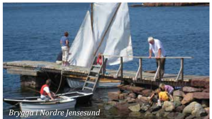
Brygga i Nordre Jensesund