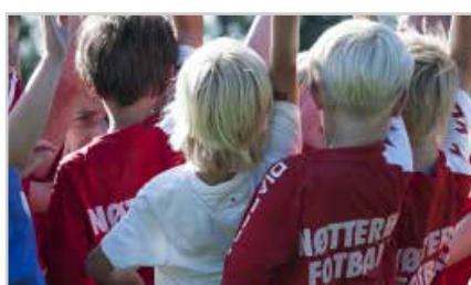
s9 | TINE FOTBALLSKOLE