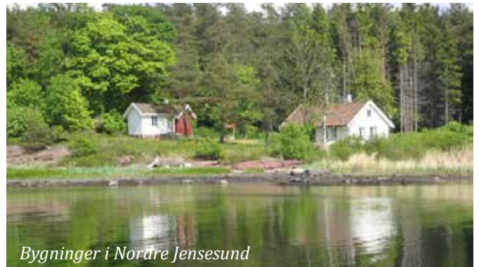
Bygninger i Nordre Jensesund

Mange har sikkert hørt om Russerleiren som ligger helt øst på øya, ned mot Kongshavn-sund. Det er lett å se hvor leiren lå, da jern-stolper stikker opp der brakkeveggene sto. I dag er alle brakkeveggene borte. De ble brent etter krigen på grunn av smittefare. Fra desember 1944 og fram til krigens slutt ble det plassert dødssyke og døende russiske fanger her i leiren. På slutten av krigen fikk fangene lov til å begrave sine døde i en av sydbuktene på øya (Gravplassen). I 1953 ble alle gravene flyttet til Vår Frelsers Gravlund i Oslo.