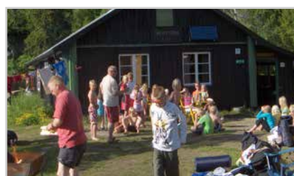
s14 | INFO FRA VELLETT