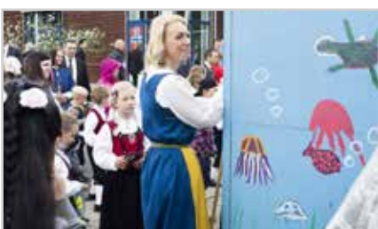
s13 | 17. MAI PÅ OSERØD SKOLE