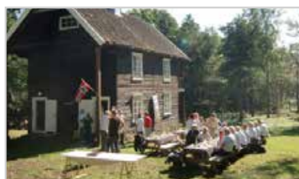
s12 | MELLEMBOLÆRENS VENNER