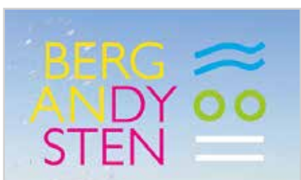
s8 | BERGANDYSTEN