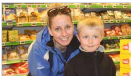
s4 | 5 på KIWI