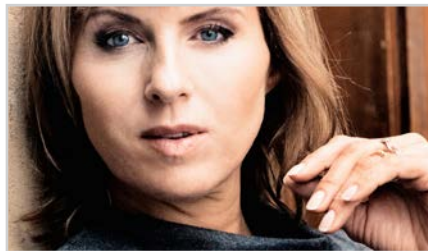
s5 | SILJE NERGAARD TRIO