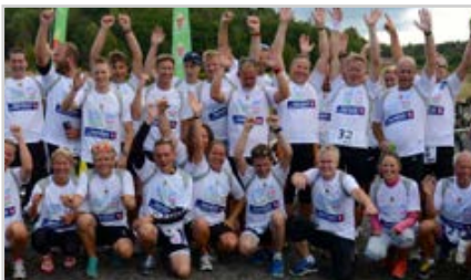
s7 | BERGANDYSTEN