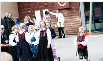
S13 | 17. MAI