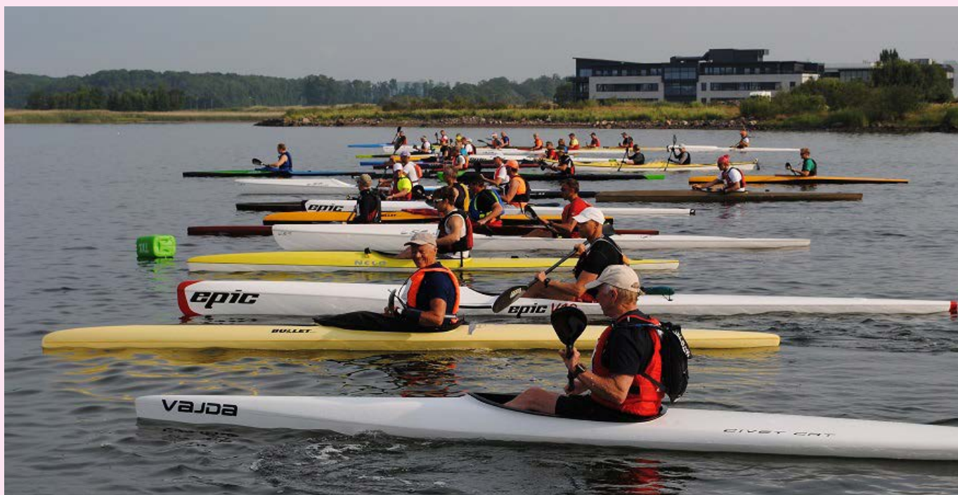
Starten på Nøtterøy rundt 2014 – 32 km med over 17 000 åretak i vente!

Lørdag 4. juli padles Nøtterøy rundt for 75. gang.