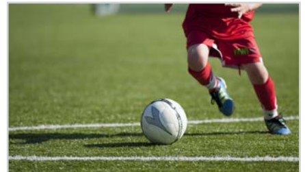
s6 | SPÅRTEN