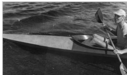
s8 | NØTTERØY RUNDT I KAJAKK