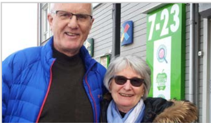
s4 | 4 PÅ KIWI