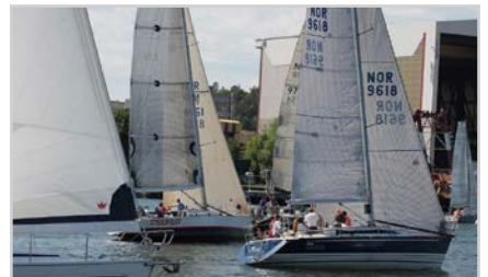
s10 | SEILSESONGEN ER I GANG