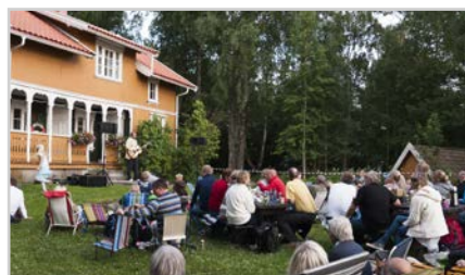
s14 | INFO FRA VELLEET