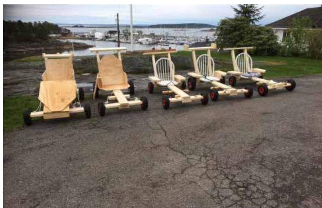
5 biler nesten klare for løp. Lakkering og pimping gjenstår

400 bildekk måtte hentes med tilhenger hos Dekk1 i Tønsberg. De ble stabled til en lang og "sikker" racerbane fra toppen av Veumåsen og nedover bakken. Start- og målområdet ble satt opp med lånte flagg fra Bertel O. Steen. Lyd- og lysanlegg