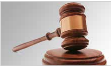
s2 | LEDER