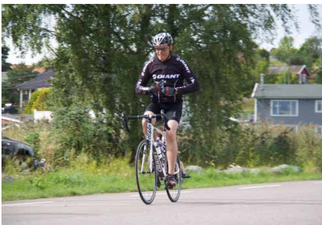
Her selveste Dysten generalen på vei inn til skiftesonen. Det er ikke utstyret det står på....

Arrangementet er meget godt tilrettelagt for at både utøvere og tilskuere. Utøvere og tilskuere skal ha så mye kontakt med hverandre som mulig. Det sykles to runder på ca. 12 km etter svømmingen. Her er det felles start fra vannet og alle de 34 startende svømmer 1 runde på ca. 350 meter.