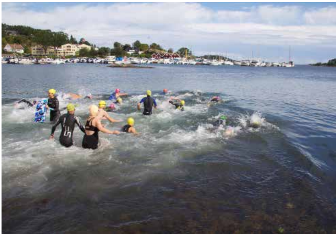
Kl 11.00 har starten gått og deltakere kaster seg på ulike vis i vannet. Kampen er i gang

Vi våger oss på å konkludere med at Bergen Dysten både er hyggelig og vakkert. Selv om dagen startet faretruende regntung og grå, var det som om alt dårlig vær ble kastet på havet rett før start. Ved startskuddet fra vannet kl 11.00 strålte solen. Deltakere sto klare for å svømme ca. 350 meter, sykle 25 km og løpe 6 km.