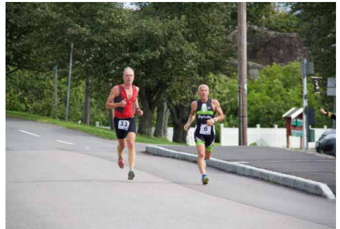
I år fikk vi mange spennende dueller like før mållinjen. Ingen vill gi seg og alle vet, det er ikke avgjort før man er helt i mål.

Det blir mye kamp om plassene, og dette skaper en god stemning på stranda og svaberget fra tilskuere som heier og skriker deltakerne frem.