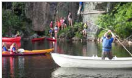
s2 | SOMMERLEIR