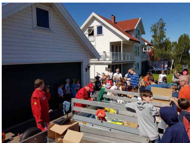
Premieutdeling med premier til alle som deltok

Med mange lokale sponsorer ble det delt ut premier til alle som deltok og salget av både kaker og saft gikk så bra at kiosken gikk tom.