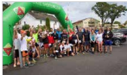
s9 | - ET VAKKERT EVENTYR