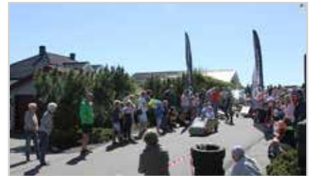
s5 | OLABIL LØP 2017