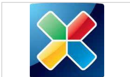
s12 | GRASSROTANDELEN