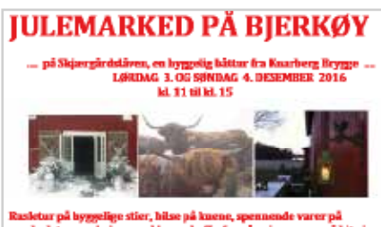
s11 | JULEMARKED