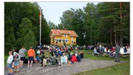
s10 | SOMMERKONSERTEN 2017